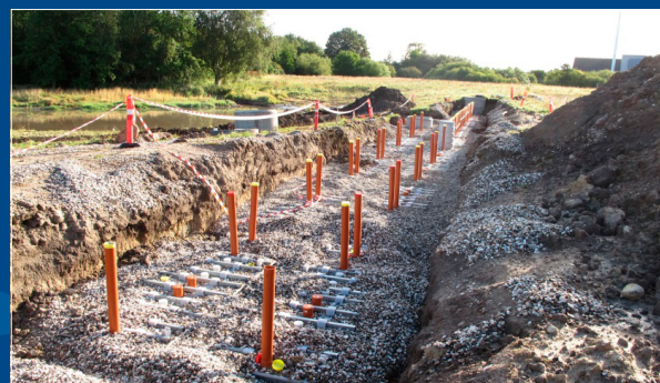
Etablering af DPF anlæg i Allerød kommune (Lyngby Nord)